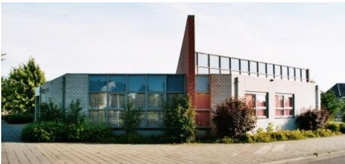
Wijkgebouw De Garve

Goedgekeurd in de vergadering van de kerkenraad van wijk 3 op 28 oktober 2014, ter inzage gelegen op het kerkelijk bureau van 24 november t/m 5 december 2014 en daarna definitief vastgesteld.