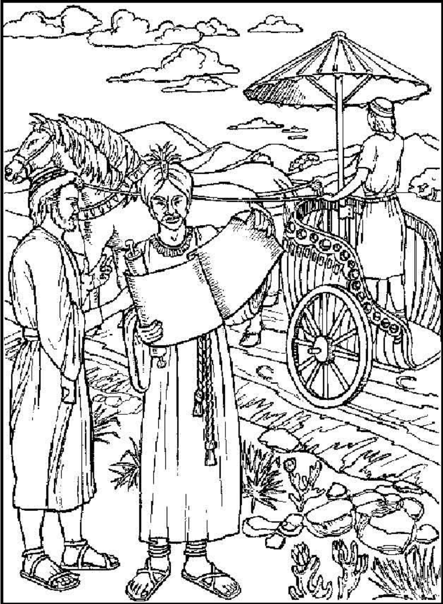
Kleurplaat over Filippus en de kamerling met zijn boekrol